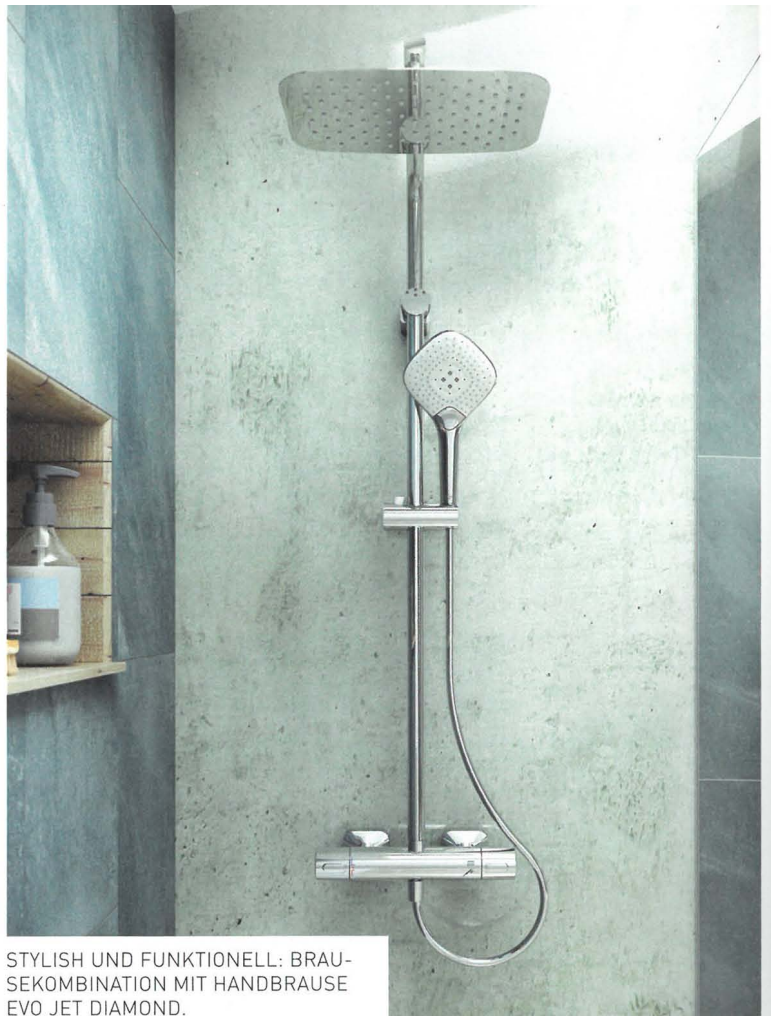
STYLISH UND FUNKTIONELL: BRAUSEKOMBINATION MIT HANDBRAUSE EVO JET DIAMOND.

— Handbrausen von Ideal Standard: EVO und EVO JET. —